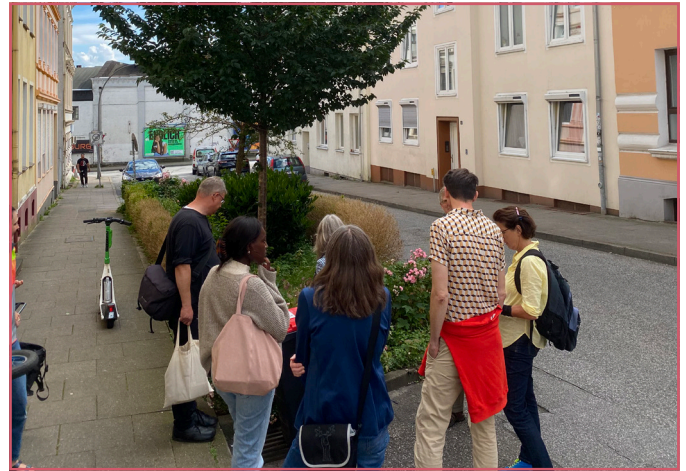
Ein Eindruck vom Quartiersrundgang (Juli 2024)