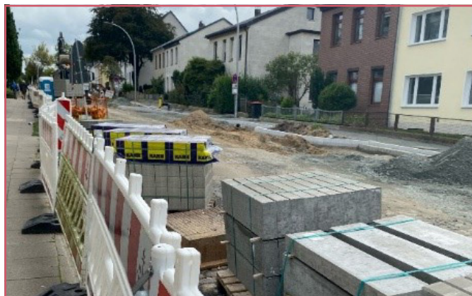
Die Jägerstraße. Hier aktuell als Baustelle.

Die Stadt hat vor kurzem den Masterplan Magistralen 2040+ veröffentlicht. Die Winsener Straße wird als eine der wichtigen Magistralen Hamburgs begutachtet und ist eine der 12 Magistralen mit gesamtstädtischer Bedeutung. Ziel der Freien und Hansestadt Hamburg ist es, die Stadträume entlang der Magistralen stadtgestalterisch und auch funktional aufzuwerten - für mehr Aufenthaltsqualität statt nur zum Durchfahren. Entlang der Winsener Straße rückt neben dem nördlichen vierspurigen Abschnitt auch der Bereich um das Nahversorgungszentrum Trelder Weg in den Fokus. Ein Ziel ist die verbesserte Öffnung des Zentrums zur Winsener Straße. Es handelt sich hierbei um einen von 10 Modellräumen. Die Ergebnisse für die Modellräume sind erste Ideen und informelle Planungen. Die Rahmenbedingungen und ggf. eine Erneuerung des Planrechts müssen in einem Abstimmungsprozess mit allen Beteiligten geprüft werden.