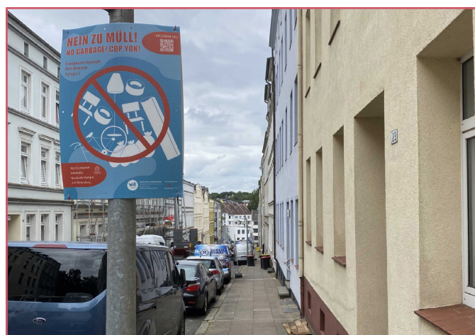
Die Plakate sind im ganzen Quartier verteilt.

Um dem Müll im öffentlichen Raum ein Zeichen entgegenzusetzen, hängen diesen Sommer an verschiedenen Orten im Stadtteil Anti-Müllplakate. Diese sind mehrsprachig und zielen darauf ab, über die Möglichkeiten zur offiziellen Müllentsorgung über Sperrmüll oder den Recyclinghof aufzuklären. Darüber hinaus verweist das Plakat auf den Melde-Michel, um zur Meldung besonders stark vermüllter Orte anzuregen. Auf einer Karte können Meldungen eingesehen und eingetragen werden, der Link zum Melde-Michel ist hier zu finden. Darüber hinaus können Beschädigungen sowie vermüllte öffentliche Orte über die App der Stadtreinigung Hamburg auf dem eigenen Smartphone gemeldet werden.