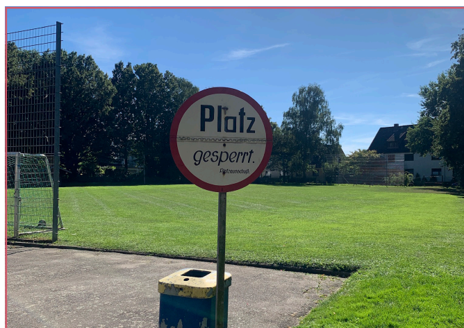
Der Sportplatz am Kapellenweg.