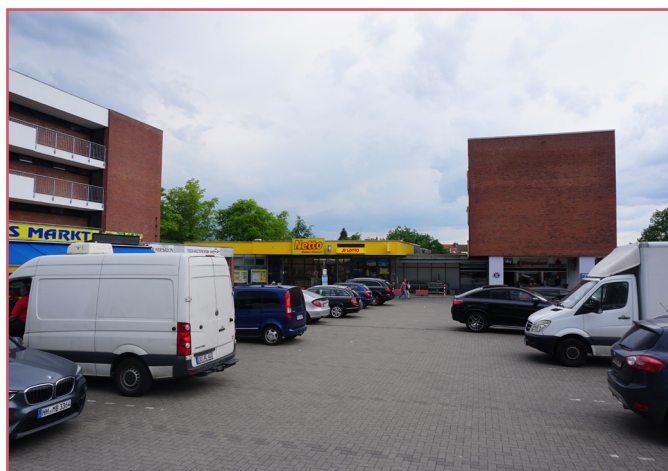
Das NVZ am Trelder Weg soll zukünftig attraktiver werden