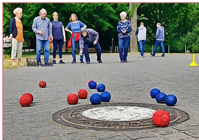
Machen Sie mit oder begleiten Sie die Gruppe auch einfach nur mal testweise!

Die „Raus aus dem Haus“-Gruppe lädt jeden Dienstag dazu ein, sich auf verschiedenen Spielplätzen in Wilstorf zu treffen und gemeinsam an der frischen Luft aktiv zu werden. Ob z.B. am Spielplatz am Reeseberg (Reeseberg 26), der Freizeitanlage Kapellenweg oder dem Abenteuerspielplatz Roseggerstraße/ Petersdorfstraße – es gibt immer etwas Spannendes zu erleben! Von Balancieren über Schaukeln bis hin zu Boßeln ist für jeden etwas dabei. Gleichzeitig können Sie untereinander Kontakte knüpfen und sich austauschen. Start- und Treffpunkt ist dienstags um 10 Uhr der EBV-Nachbarschaftstreff in der Kniggestraße 9. Mehr Informationen und die Anmeldung erhalten Sie von Antje Schwenke (EBV) unter 040/ 76404-116 oder 0171-3353870 – Wir freuen uns auf Sie!