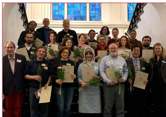
Mehr Informationen finden Sie auf der Webseite .

ab Oktober 2024 jeden Donnerstag von 17 bis 19 Uhr