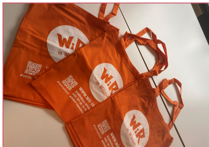
Neue WiR-Jutebeutel im Stadtteilbüro Wilstorf

Greift also schnell zu und sichert euch euren WiR-Jutebeutel, bevor sie vergriffen sind.