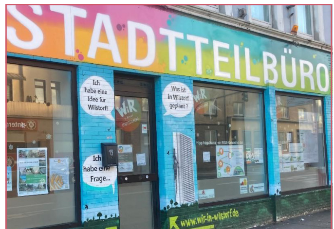
Vorbeischaun lohnt sich! Im Stadtteilbüro finden sich viele Angebote!

Im Stadtteilbüro findet mittlerweile ein vielfältiges Angebot an spannenden Aktivitäten statt, die von unterschiedlichen Akteuren und Träger:innen organisiert werden. Neben dem wöchentlichen Nachbarschaftsfrühstück gibt es ein Upcycling-Nähkurs, einen Malkreis und einen Englischkurs für Senior:innen, das zweiwöchentliche Männercafé, die Bewerbungshilfe für Frauen (PAULA-Projekt) sowie einen Kurs, der Frauen beim Umgang mit dem Computer unterstützt und ihnen grundlegende digitale Fähigkeiten vermittelt. Komm' doch gern vorbei! Der aktuelle Belegplan findet sich hier .