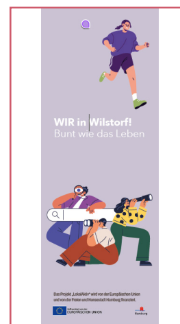
So könnte der Quartiersflyer aussehen.

Auf Initiative des Vereins Unternehmen ohne Grenzen e.V. (UoG) wird mithilfe des Verfügungsfonds Wilstorf ein Flyer erstellt, mit dem Ziel, lokale Geschäfte zu verorten und somit ihre Sichtbarkeit zu erhöhen. Außerdem dient der Flyer der Identität und des Bewusstseins des Stadtteils für seine vielfältige lokale Ökonomie. Dadurch sollen Anwohner:innen und die lokale Wirtschaft besser vernetzt und vertraut miteinander gemacht werden. Als wesentliche Informationsquelle erleichtert der Quartiersflyer es den Anwohner:innen, insbesondere lokale Kleinsbetriebe sowie soziale Einrichtungen im und um das Fördergebiet Wilstorf-Reeseberg zu finden. Der fertige Flyer wird nach Fertigstellung an zentralen Orten im Quartier (z.B. Stadtteilbüro Wilstorf) ausgelegt sowie ist als Download-Datei auf unserer Internetseite verfügbar sein. Aktuelle Informationen folgen!