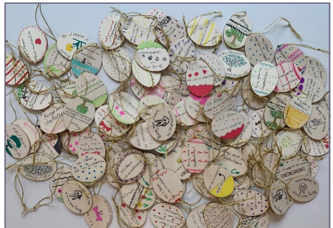
Zahlreiche Kinder nahmen an der Aktion teil und freuten sich über die Belohnung.

Im Zeitraum vom 14. bis zum 17.04.25 fand eine Ostereiersammelaktion für Kinder in Wilstorf statt. Hierfür wurden buntbemalte Holz-Ostereier auf den fertiggestellten RISE-Spielplätzen Kapellenweg, Reeseberg, Winsener Straße und dem Abenteuerspielplatz Roseggerstraße verteilt. Die teilnehmenden Kinder konnten die Holz-Ostereier im Stadtteilbüro abgeben und erhielten im Gegenzug einen Jutebeutel im WiR-Merchandise Design sowie einen Schokoladenosterhasen.