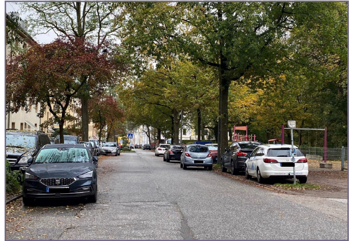
Die Straßenbauarbeiten am Reeseberg haben im ersten Bauabschnitt begonnen.

Am 08.09.2025 hat die Grundinstandsetzung des Reesebergs zwischen Anzengruberstraße und Friedrich-List-Straße im ersten Bauabschnitt begonnen. Die Maßnahme ist Teil des RISE-Stadtentwicklungsprogramms zur Verbesserung der Erreichbarkeit des Spielplatzes „Reeseberg“ und der Verkehrssicherheit in der Tempo-30-Zone. Die Straßenbauarbeiten erfolgen unter Vollsperrung und dauern voraussichtlich bis Mitte Dezember 2025. Insgesamt werden Fahrbahn, Gehwege und Parkstände instandgesetzt und in Teilbereichen erneuert. Das Quartier bleibt über Winsener Straße, Jägerstraße, Radickestraße und Meckelfelder Weg erreichbar. Rad- und Fußverkehr können den Bereich weiterhin passieren. Aktuelle Informationen können Sie hier dem Baustellenmelder entnehmen.