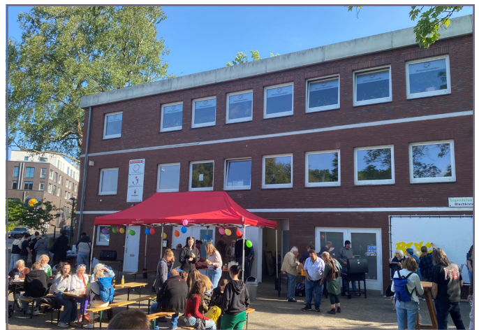
Die Außenanlage des Jugendclubs Blechkiste e.V. wurde erneuert und feierlich eingeweiht (Bildquelle: BIG Städtebau GmbH).

Anlässlich der Umgestaltung der Außenanlage Rönneburger Straße 6 veranstaltete der Jugendclub Blechkiste e.V. in Kooperation mit der Mobilen Suchtprävention Harburg und Rauchzeichen e.V. Ende Mai eine Eröffnungsfeier. Im Rahmen der Aufwertung wurde die Grundstücksumzäunung und die Treppenanlage mit Geländer erneuert. Weiterhin wurden neue Außenmöbel, darunter Sitzgelegenheiten, Mülleimer, Hochbeete und Beleuchtung installiert und Flächen entsiegelt. Hierdurch gewinnt die Außenanlage langfristig an Aufenthaltsqualität. Finanziert wurde die Aufwertung mithilfe privater Mittel der Eigentümerin, Mitteln des Jugendhilfeausschusses sowie RISE-Mitteln.