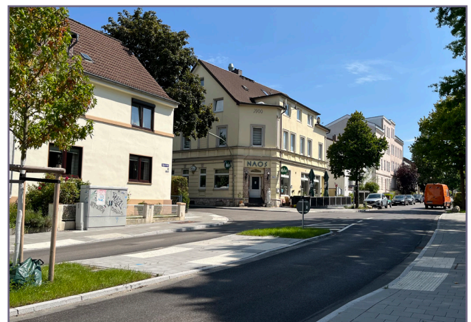
Die Umgestaltung der Jägerstraße bringt eine Verkehrsberuhigung und mehr Platz für Fußgänger:innen und Fahrradfahrer:innen.

Überzeugen Sie sich selbst vom neuen Bild der Jägerstraße!