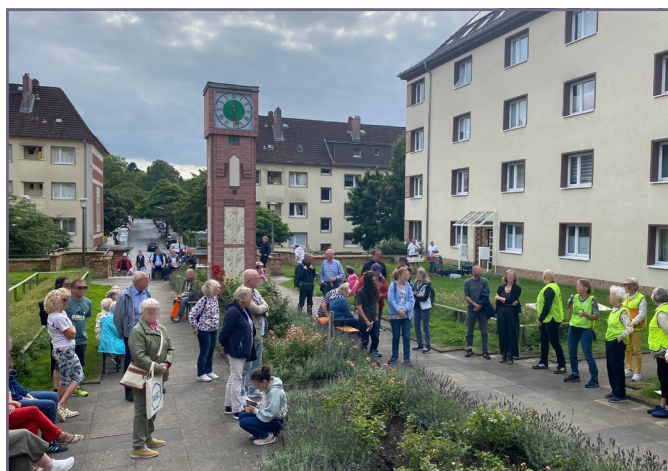
Zum Sommerabend an der Rosentreppe kamen Wilstorfer:innen zum gemeinsamen Austausch und Miteinander zusammen.

Am 06.08.2025 wurde die Rosentreppe im Wohnquartier des Eisenbahnbauvereins Harburg eG zum lebendigen Treffpunkt: Rund 50 Wilstorfer:innen kamen bei gutem Wetter, Musik, Snacks und kühlen Getränken zusammen, um das Miteinander im Stadtteil zu feiern. Verschiedene lokale Initiativen wie „Harburg blüht“, die Lokale Vernetzungsstelle Gesundheit, die Raus-aus-dem-Haus-Gruppe Wilstorf und wir von der Gebietsentwicklung Wilstorf-Reeseberg stellten sich mit Info- und Mitmachangeboten vor. Die Veranstaltung zeigte: Die Rosentreppe ist ein Ort mit viel Potenzial für nachbarschaftliches Miteinander und Austausch. Vielen Dank an alle Beteiligten, die den Abend ermöglicht haben!