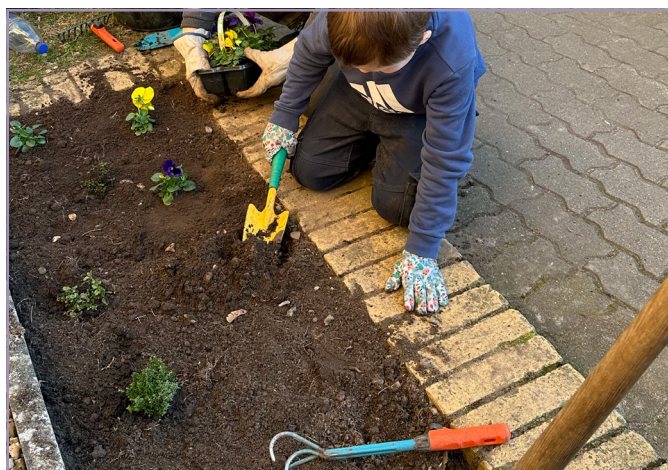
Pflanzaktion für Alt und Jung, mit der Initiative „Harburg blüht“.

Im Projekt „Wilstorf kann grüner“ engagiert sich eine Gruppe von Bürger:innen für ein grüneres und lebenswerteres Wilstorf. Sie entwickeln Ideen und setzen Maßnahmen um, die das ökologische Bewusstsein fördern und die Aufenthaltsqualität im Stadtteil erhöhen. Dazu gehören Pflanzaktionen – etwa am Vinzenzhaus, Reeseberg 30 und der Rosentreppe –, die Installation von Nistkästen sowie Workshops zu Stadtgrün und naturnahem Gärtnern. Mit der Fassadenbegrünung am Reeseberg plant die Gruppe ein Pilotprojekt in Hamburg. Interessierte sind herzlich zum „Grünen Tisch Wilstorf“ im Stadtteilbüro eingeladen. Eine Anmeldung zum Mitmachen ist unter harburg-blueht@asb-hamburg.de oder unter 017 – 42 44 466 möglich. Neue Mitglieder:innen sind jederzeit willkommen.