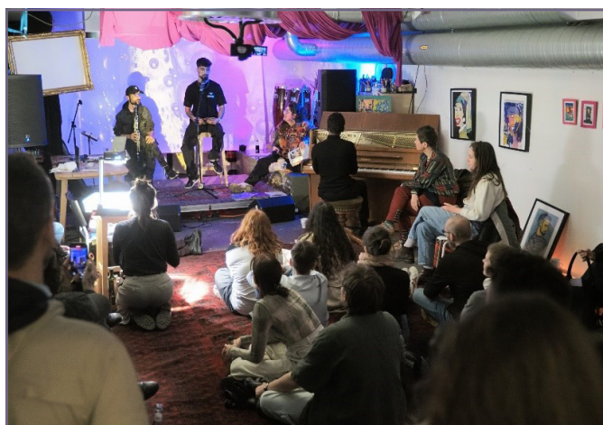
In Wilstorf können Technikgeräte ausgeliehen werden.

Im Jahr 2021 hat die Paul-Gerhardt-Gemeinde (heute: Segensgemeinde) mithilfe des Verfügungsfonds Technikgeräte wie Mikrofone, Lautsprecher, ein Mischpult u.v.m. angeschafft, um sie über ein Ausleihsystem der Stadtteilöffentlichkeit zur Verfügung zu stellen. Dieses System wurde erfolgreich betrieben, jedoch sieht sich die Gemeinde nun aus zeitlichen und personellen Gründen nicht mehr in der Lage, das Projekt weiterzuführen. Erfreulicherweise hat sich der Kulturwohnzimmer e.V. bereit erklärt, das Projekt zu übernehmen. Mithilfe des Verfügungsfonds wurden u.a. weitere Mittel für die Aktualisierung der Online-Verleihplattform sowie stärkeren Bewerbung des Angebots in den Sozialen Medien genutzt. So kann das Projekt auch zukünftig bestehen bleiben.