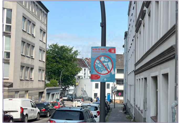
Mit Plakaten wird ein Zeichen gegen Vermüllung des Quartiers gesetzt und die Anwohner:innen sensibilisiert.

In diesem Jahr wurden erneut mehrsprachige Anti-Müll-Plakate in Wilstorf aufgehängt, die über die offiziellen Entsorgungsmöglichkeiten für Sperrmüll und die Nutzung des Recyclinghofs informieren. Denn auch im Fördergebiet Wilstorf-Reeseberg kommt es immer wieder zu unsachgemäß abgestelltem Sperrmüll, der das Stadtbild belastet. Helfen Sie uns, weitere Problemstellen zu identifizieren, indem Sie an unserer Online-Beteiligung teilnehmen. Ihre Hinweise sind wertvoll, um Problempunkte in Wilstorf-Reeseberg zu lokalisieren. Weitere Informationen zur Online-Beteiligung finden sich auf unserer Webseite .