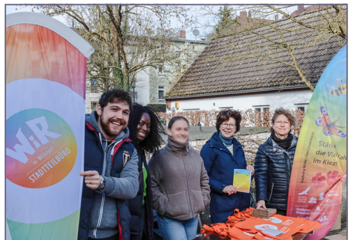
Die Clean-Up-Aktion bringt die Menschen im Quartier für einen guten Zweck zusammen.

Im Rahmen der Aktion „Hamburg räumt auf!“ fand am 01.03.25 eine Aufräumaktion statt. An drei Orten (Geschäftsstelle: Rosentreppe 1 A, Gottschalkring 8: Am Heizhaus, Höpenstraße: Parkplatz neben der Kita) in und um Wilstorf konnte durch zahlreiche helfende Hände eine Menge Müll aus dem öffentlichen Raum aufgesammelt werden. Für diesen Einsatz zur Verbesserung des Quartiers danken wir allen die dabei waren. Organisiert wurde die Veranstaltung von der Eisenbahnbauverein eG und der Initiative „Harburg blüht“ mit freundlicher Unterstützung des Stadtteilbüros Wilstorf-Reeseberg. Für den 17.10.25 ist eine weitere Aufräumaktion in Wilstorf geplant. Weitere Informationen hierzu folgen.