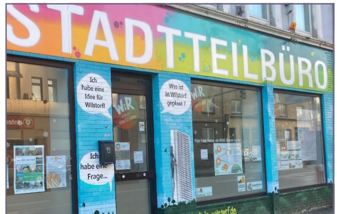
Schauen Sie gern in unserem Stadtteilbüro vorbei, dort gibt es viele Angebote und Kurse zum Mitmachen.

Der aktuelle Belegplan ist hier zu finden.